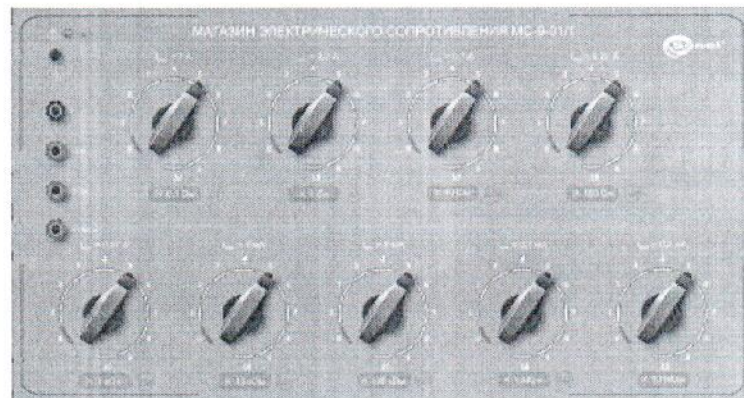
Рисунок 1 – Фотография общего вида магазинов электрического сопротивления.

Общий вид магазинов представлен на рисунке 1.